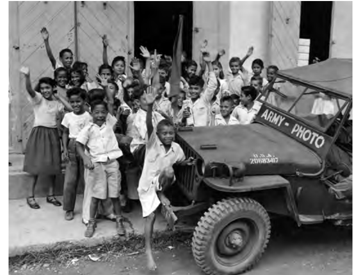
Schoolchildren greet the Aggressor Force convoy during their recess as it passes through the town of Isabel Segunda, on its way to the maneuver area. (NA)

Un francotirador del 65 mira detenidamente desde su trinchera camuflada con vista a la Playa Roja.