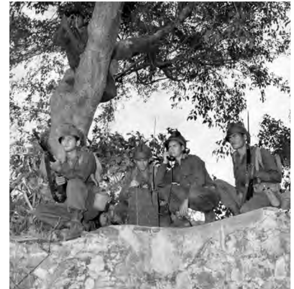
A reconnaissance patrol of the Aggressor Force, using Signal Corps field communications, observe the invasion beach areas.

El cabo Carlos Ruiz (centro) con un equipo Agresor de ametralladoras móviles de calibre .50.