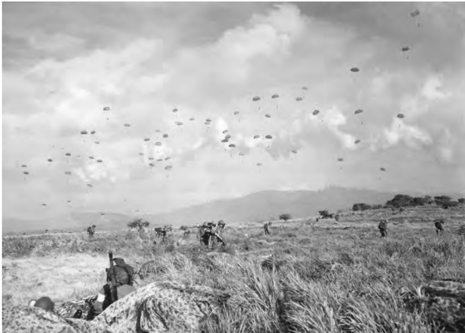
Paratroopers descend upon a small airstrip. (NA) Los paracaidistas descienden sobre una pequeña pista de aterrizaje.