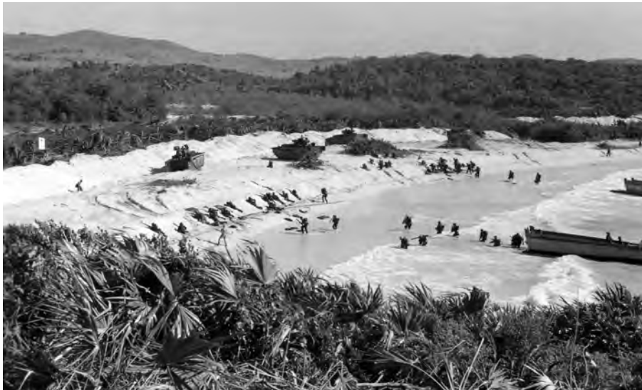
The second wave of the 3rd Inf Div comes ashore on Vieques Island during Portrex D-Day, 8 March 1950.