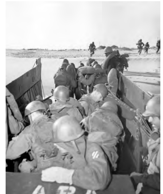
Men of the 3rd Inf Div leaving a landing craft at a beach on D-Day.