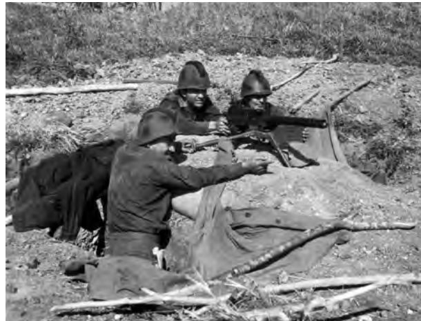
An Aggressor fires at the enemy. (NA) Un Agresor dispara al enemigo.

— Árbitro de Agresor Mayor al Cnel. William W. Harris