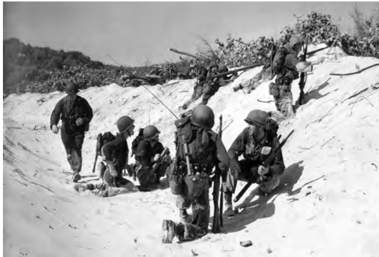
Troops of the 3rd Inf Div attempt to break through beach defenses.