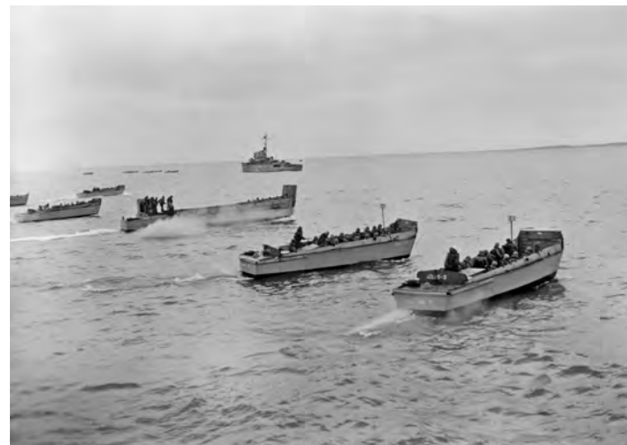
LCVPs, loaded with troops, at line of departure prior to hitting beach at Vieques.