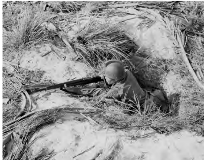
A sniper of the 65th peers out of his camouflaged foxhole overlooking Red Beach. (NA)

La patrulla de reconocimiento de la Fuerza Agresora con comunicaciones de campo del Cuerpo de Transmisiones observa las áreas de invasión de la playa.