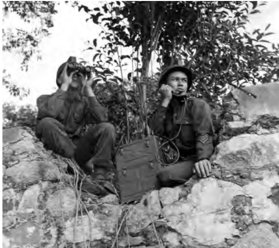
The Aggressor Force reconnaissance patrol with Signal Corps field communications observe the invasion beach areas.

La patrulla de reconocimiento de la Fuerza Agresora con comunicaciones de campo del Cuerpo de Transmisiones observa las áreas de invasión de la playa.