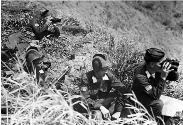
Aggressor officers and men, clad in their distinctive jungle green uniforms, stationed in a well-concealed observation post. (NA)

Oficiales y hombres Agresores, vestidos en sus distintivos uniformes verde selva, posicionados en un puesto de observación oculto.