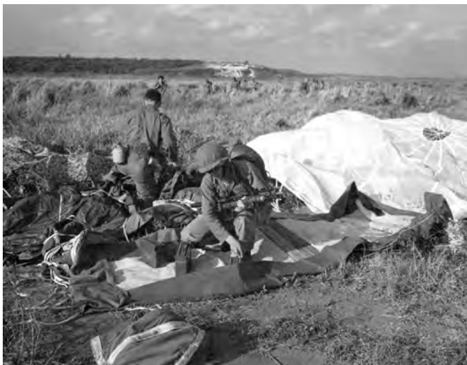
A paratrooper assembles his .30 caliber light machine gun. (NA) Un paracaidista ensambla su ametralladora ligera calibre .30.